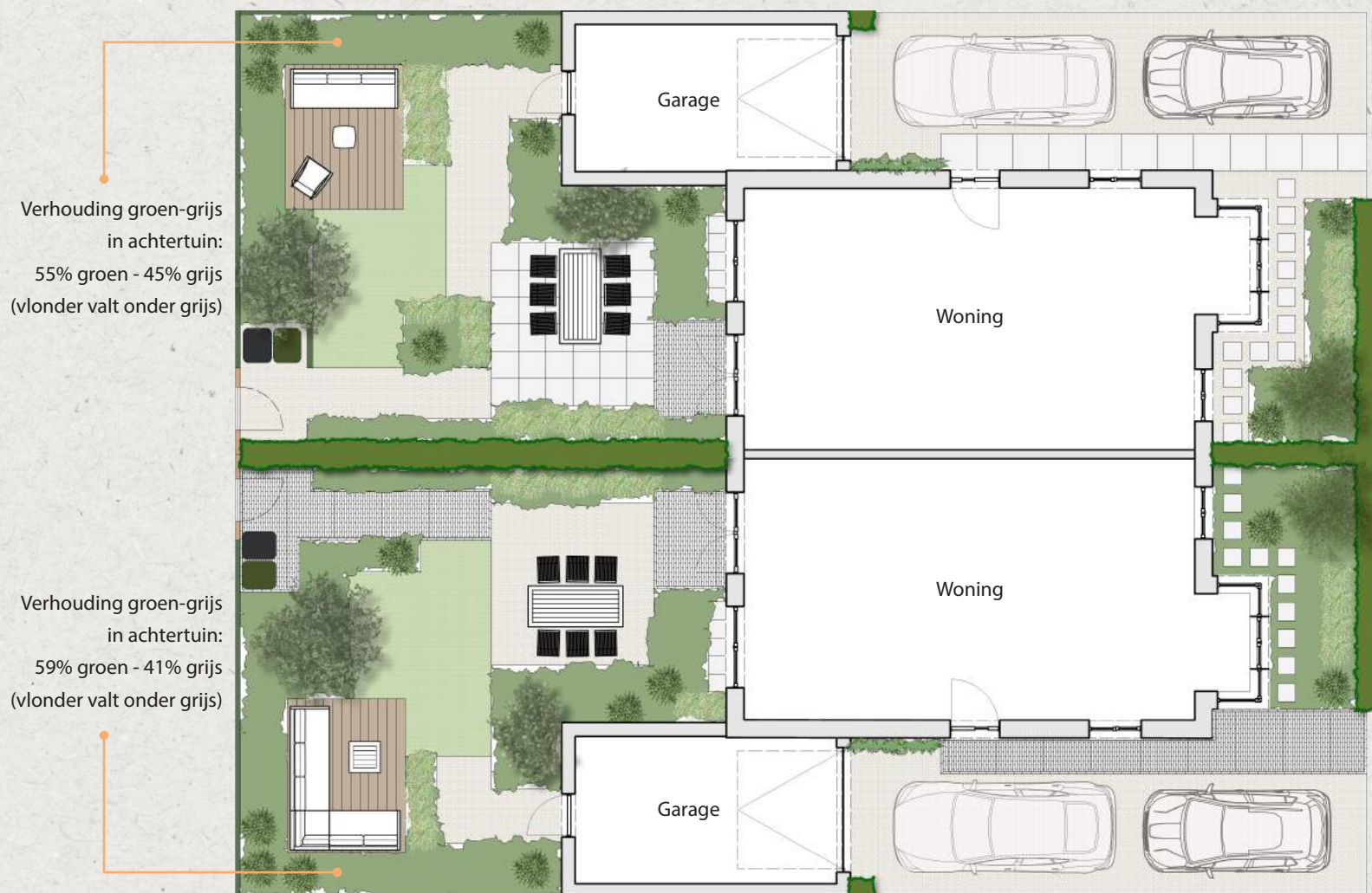
Voorbeeld tuinontwerp bij een twee-onder-een-kapwoning.